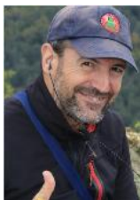
73 de Guru – EA2IF (miembro del equipo global de publicidad SOTA)

Para más información sobre el programa Summits on the Air – SOTA, visiten, por favor, http://www.sota.org.uk