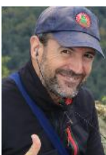
73 de Guru – EA2IF (miembro del equipo global de publicidad SOTA)

Para más información sobre el programa Summits on the Air – SOTA, visiten, por favor, http://www.sota.org.uk