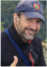
73 de Guru – EA2IF (miembro del equipo global de publicidad SOTA)

Para más información sobre el programa Summits on the Air – SOTA, visiten, por favor, http://www.sota.org.uk