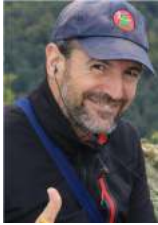
73 de Guru – EA2IF (miembro del equipo global de publicidad SOTA)

Para más información sobre el programa Summits on the Air – SOTA, visiten, por favor, http://www.sota.org.uk