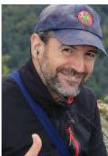
73 de Guru – EA2IF (miembro del equipo global de publicidad SOTA)

Para más información sobre el programa Summits on the Air – SOTA, visiten, por favor, http://www.sota.org.uk