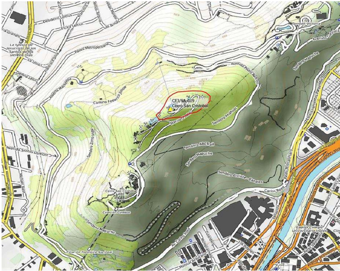
Base map copyright OpenStreetMap contributors

Por Guru – EA2IF (miembro del equipo global de publicidad SOTA)